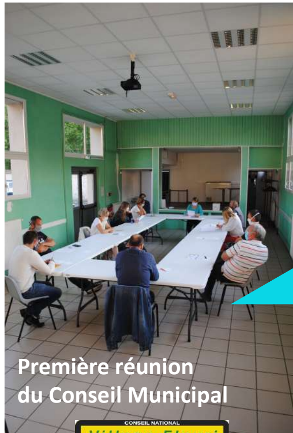
Première réunion du Conseil Municipal

Journal d'informations de la commune N° 27 / JUILLET 2020