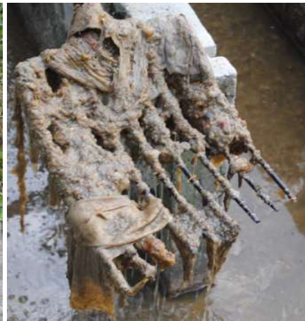
Les lingettes sont les bêtes noires du « Tout à l'égout »...