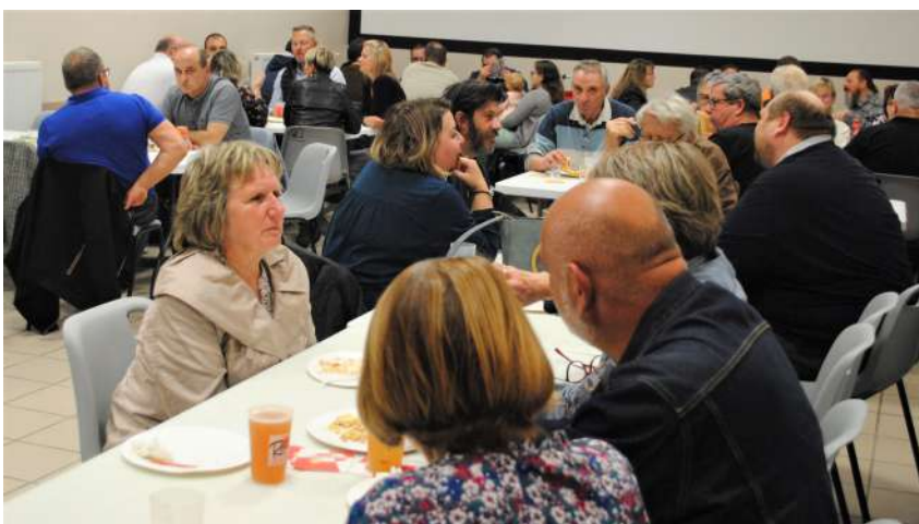
Une belle soirée conviviale dont tous se souviendront !